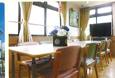
▲共用スペース/リビング

「お一人の空間をスッキリと使い勝手のよいワンルームタイプ」 ※お部屋の大きさは6畳程度です。家具の配置例です。