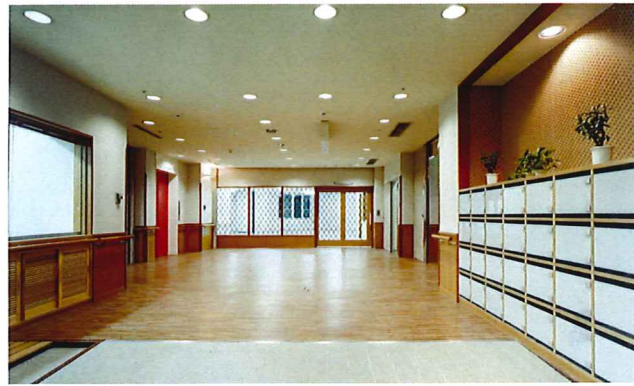
正面エントランスホール