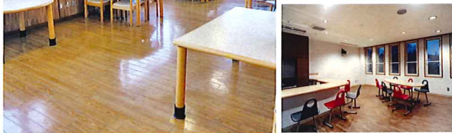
大自然一望の食堂