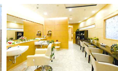
いつまでも美しくいていただくための理美容室