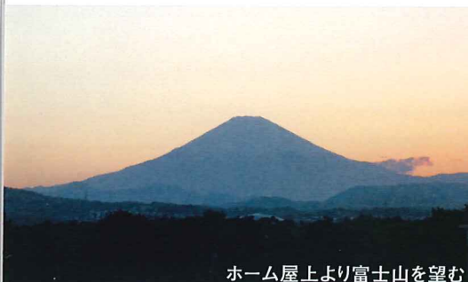
ホーム屋上より富士山を望む