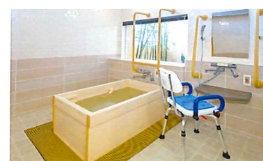
ゆったりとした気分に入れるヒノキ風呂