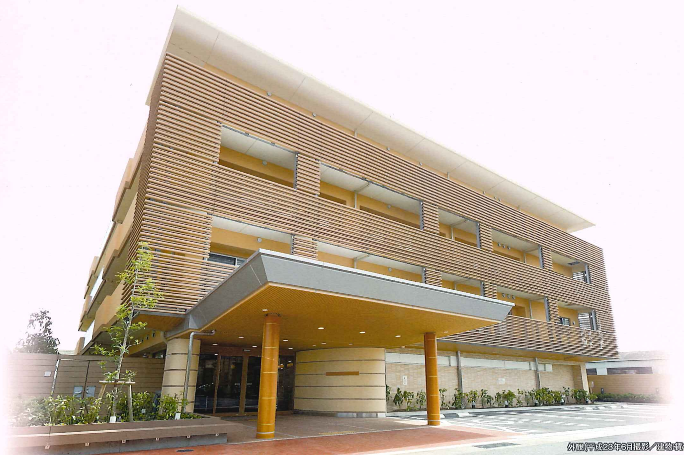
外観(平成28年6月撮影/建物賃借)

開放感いっぱいの屋上テラスが自慢。 湘南の自然と文化に心潤す暮らしが始まります。