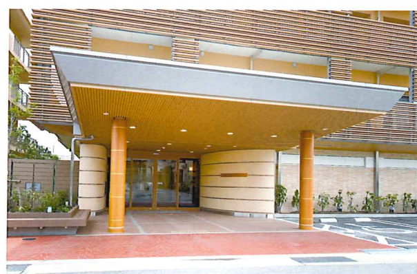
ここに住まう方々やご家族を優雅に迎えるエントランス ※建物写真は平成23年6月撮影/建物:賃借

日本有数の別荘地としての文化と歴史を誇る湘南エリア。 温暖な気候と開放的な住環境が魅力の地に 「SOMPOケア ラヴィーレ湘南平塚式番館」があります。 広々とした屋上テラスからは壮大な富士山を望め、 上品で心地良い共用空間では ご入居者さま同士の楽しい会話が弾みます。 癒しに満ちた快適なホームで、 心からくつろげる日常をお愉しみください。