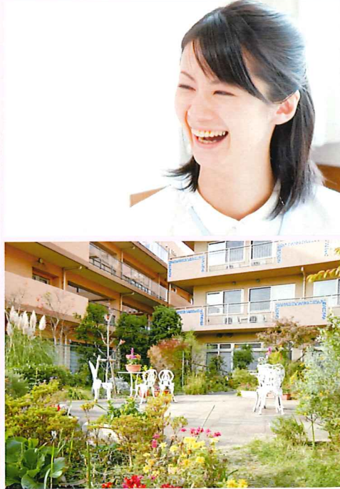
建物写真は平成28年11月撮影。建物賃借 ※一部写真はイメージです。