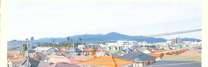
ホームからの景色(関東百名山の大山を望む)