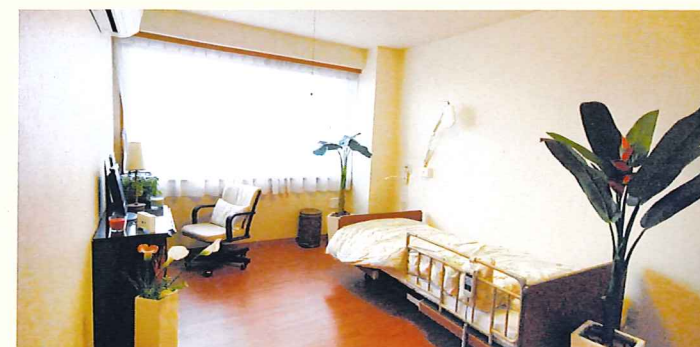
居室(モデルルーム)

お気に入りの家具を持ち込んでいただき、ご自分らしいインテリア で楽しんでいただける居室。たっぷりとする収納庫も備えておりま す。安心してお過ごしいただけるよう、緊急コールを各室、トイレに 設置し、車椅子の利用にも配慮しています。