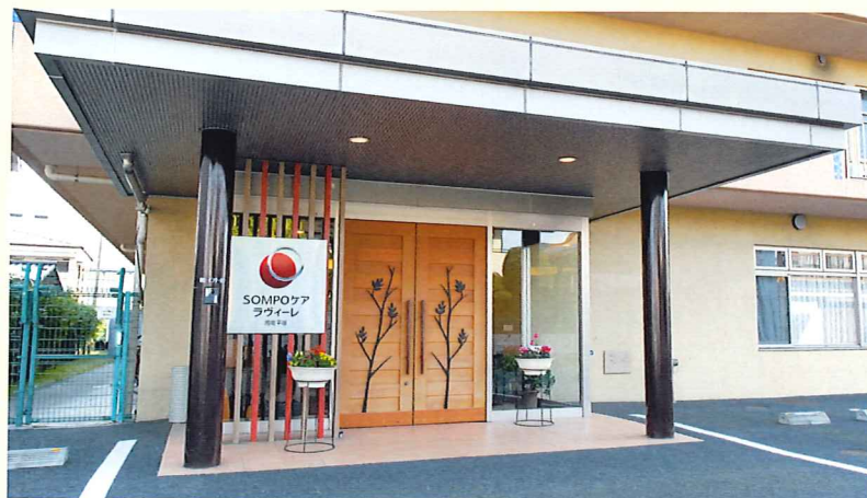
ここに住まう方々やご家族を優雅に出迎えるエントランス(平成28年11月撮影/建物:賃借)

湘南の邸宅、「SOMPOケア ラヴィーレ湘南平塚」。四季折々の緑をお楽しみいただける、大きな中庭は、みんなが集う 快適なくつろぎ空間です。湘南の緑とやわらかな風に包まれた、心地よい日々を、ここ湘南平塚でお過ごしください。