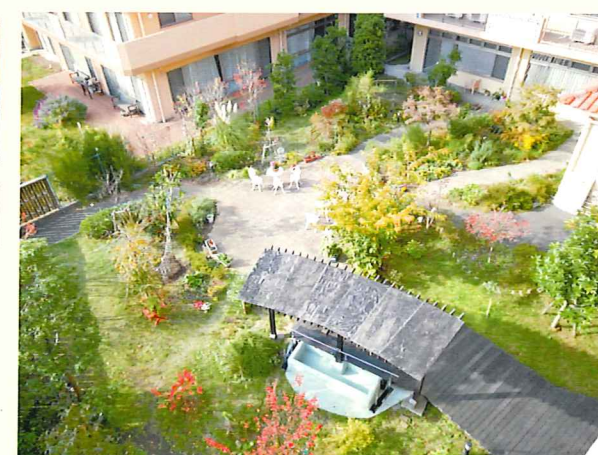
心身を癒す緑豊かな中庭