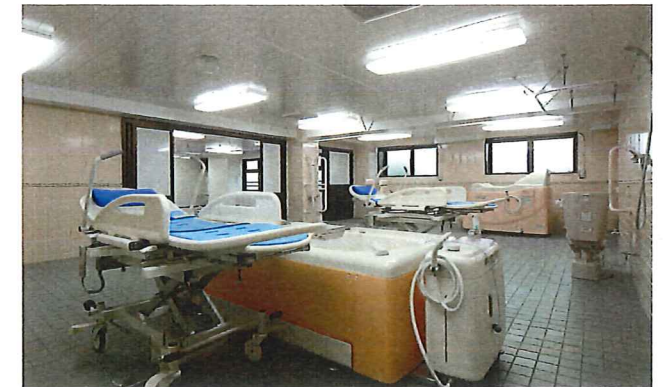
車椅子や寝たままの状態での入浴ができる特殊風呂も完備。