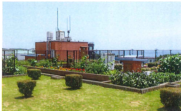
花壇や菜園をしつらえた屋上は、海も山も見渡せる最高の眺め。