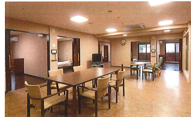
お食事や談笑にご利用いただけるリビングルーム。

居室はすべて個室タイプで、15㎡以上の広々とした空間を確保。自宅のようにくつろいでいただくため、使い慣れたご自身の家具を持ち込めるようにしています。茶色と白の清潔感あるデザインと、日差しをたっぷり取り込む大きな窓が特長です。