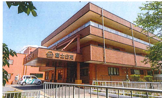
特別養護老人ホームが入っている棟の正面エントランス。

平塚市と大磯町の境にある平塚富士白苑は、海と山を同時に望める絶好のロケーション。屋上へのぼると目の前には相模湾が広がり、背後には緑豊かな湘南平が横たわっています。箱根駅伝や大磯花火大会などを間近で楽しめるのも、平塚富士白苑ならではの。