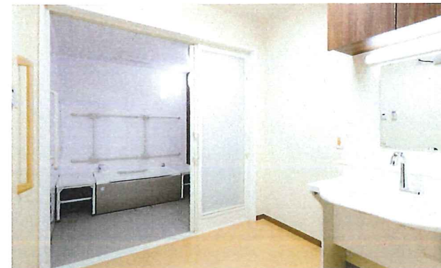
安全に配慮された設計で、リラックスできるバスルーム。