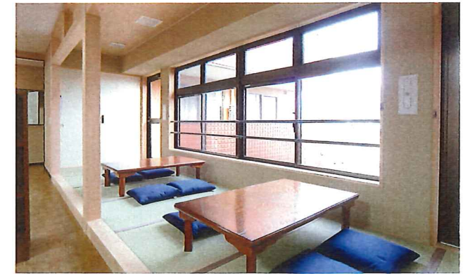
リビングルームには、ほっとひと息つける和室を設けています。