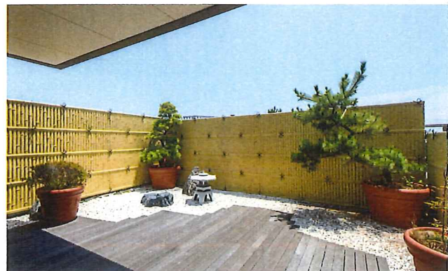
日本庭園を模した中庭。ゆくゆくは足湯も設置する予定です。