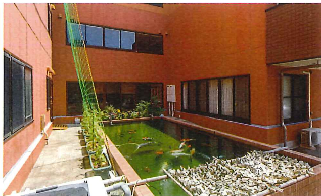
正面エントランスの傍には、錦鯉が泳ぐ池も。